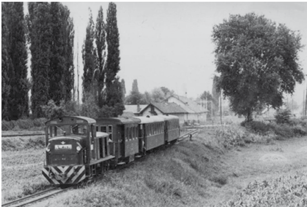
Zakatol a vonat

vezett. Az alsótanyai lakosok lovaskocsival közlekedve 4-8 óra alatt értek Szegedre. Így a tanyai termények és a tanyai vásárlók egyaránt hiányoztak Szeged piacáról.