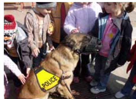
A kedvenc rendőrünk

bá tételéhez. A szülők szívesen segítettek a virágágyások kialakításában, beültetésében, az udvar rendbetételében. Ezúton szeretnénk megköszönni aktív részvételüket.