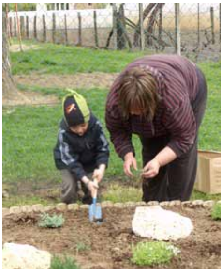
Palántázzák a palánta

A Víz világnapjához kapcsolódóan a gyermekek megismerkedtek a helyi víztorony üzemeltetésével, a könyvtárban élvezetes bemutatón, előadáson vehettek részt,