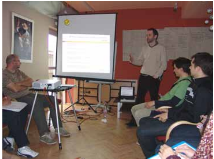
...és így leszünk még jobbak

Hogy ez a munka még hatékonyabb legyen, szükség van az egyes településeken dolgozó fiatalok munkájának összehangolá-