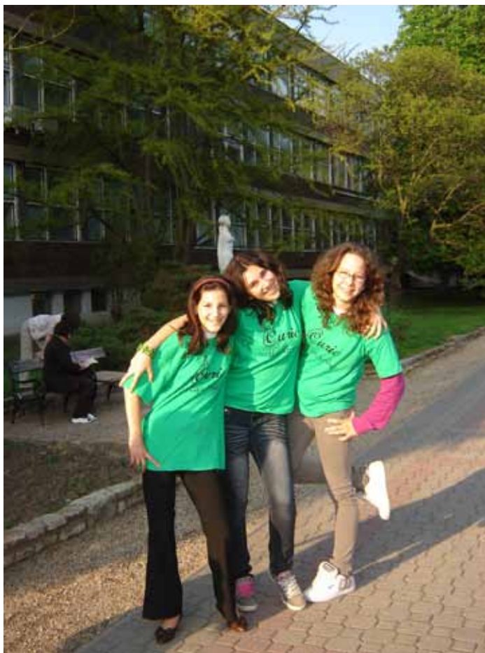
Verseny után - szabadon