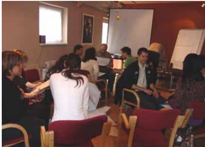
Csapatban is jók vagyunk...